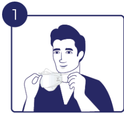
깨끗한 손으로 마스크의 3면을 엽니다.