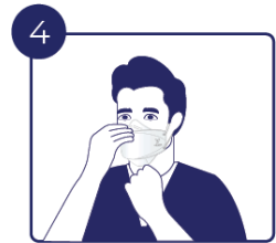
코 지지대를 구부려 얼굴에 맞추고 마스크의 아랫부분이 턱을 잘 감싸도록 합니다.